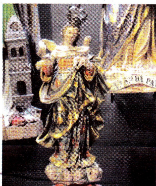
Nossa Senhora, séc. XVIII

O Museu da Santa Casa da Misericórdia do Porto (abreviadamente MMIPO) está situado em pleno centro histórico do Porto, na rua das Flores, atualmente em local de passagem entre S. Bento e a zona ribeirinha (em rua finalmente pedonal), próximo de locais onde houve conventos. A sua igreja estava colocada de forma a ser vista e ser ponto de encontro para quem subia desde a ribeira até ela. Hoje não é assim: a fachada da igreja, da autoria de Nicolau Nasoni, fica encaixada entre casario e a rua que conduziria até ela, prolongamento da rua de S. João, ficou tapada por casario em torno da nova rua aberta no século XIX que encobriu o rio da cidade. A Misericórdia do Porto, que ali tem a sua sede, decidiu utilizar esse espaço para a instalação de um Museu que desse a conhecer a história da instituição, desde finais do século XV até à atualidade. Com