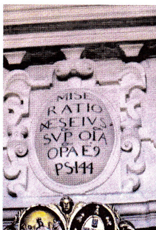
Apelo à misericórdia divina

Sobressaem esculturas oriundas desde o século XVI e XVII, obras de pintores locais e outros que vieram de fora da cidade e mesmo do país.